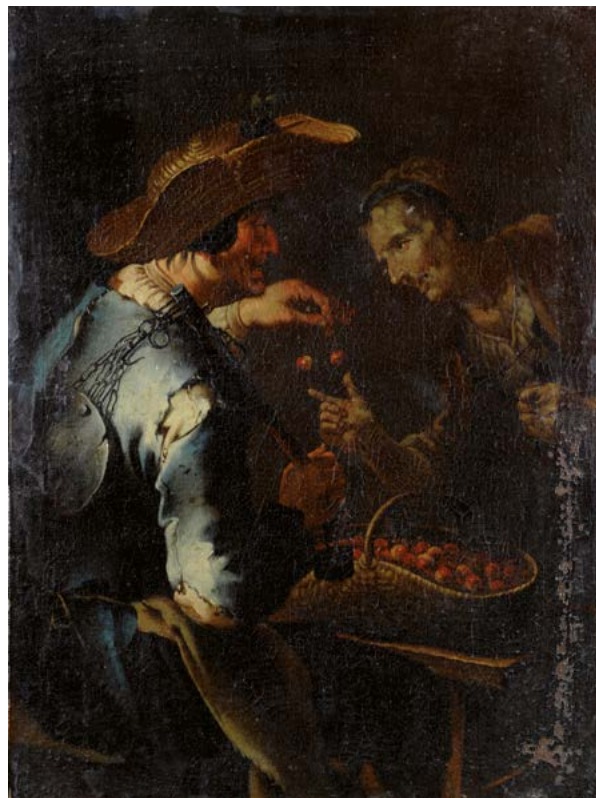
111 Giuseppe Zocchi (1711 - 1767)