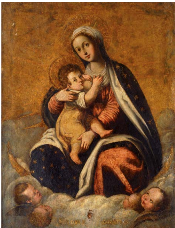
108 Scuola Italia meridionale, XVI-XVII sec. MADONNA DEL LATTE Olio su tela, cm. 91 x 70